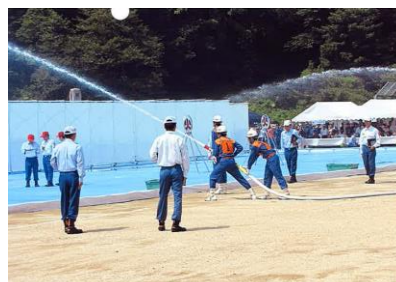
写真② (千葉県消防操法大会) (H. 25. 7. 27開催)