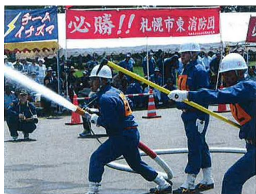
写真① (北海道消防操法訓練大会) (H. 25. 7. 19開催)

各都道府県消防操法大会は、各都道府県消防学校屋外訓練場、市民グラウンド等の公共施設を会場として、ポンプ自動車操法及び小型ポンプ操法などの消防操法が、大会出場者、大会関係者及び多くの住民等見学者の参加を得て行われた。